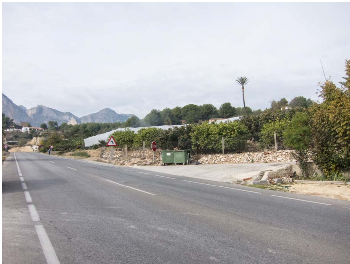
Foto nº. 3 : Desde el punto de Observación 3 (desde la carretera pasado el invernadero en dirección Callosa) con un umbral de visibilidad de 125 m.