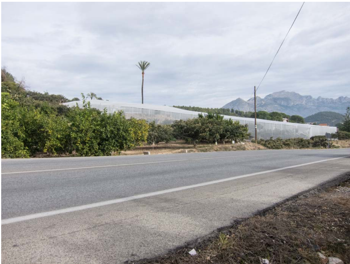
Foto nº. 2 : Desde el punto de Observación 2 (desde la carretera antes de llegar al invernadero en dirección Callosa)