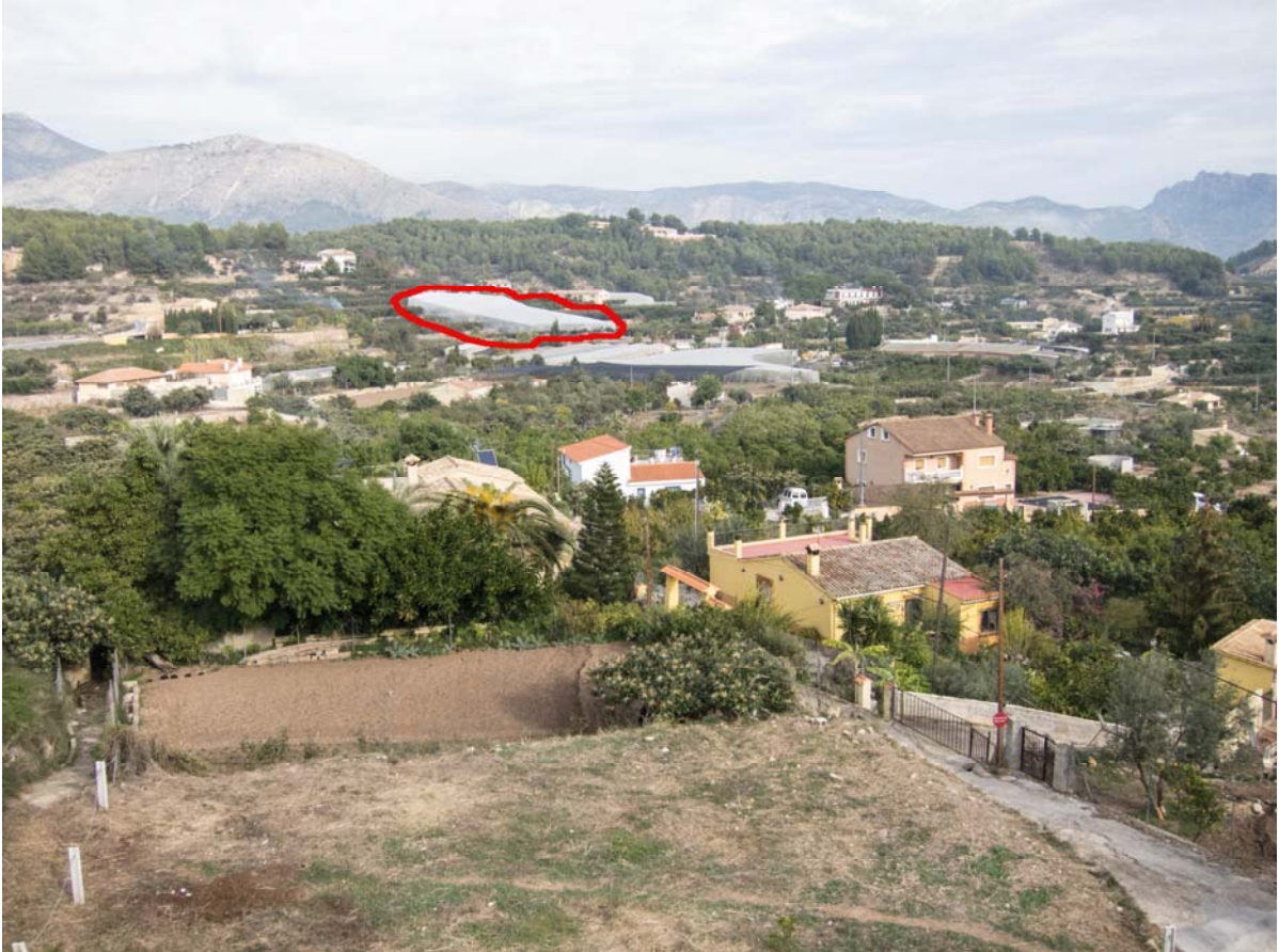
Foto nº. 1 : Desde el punto de Observación 1 (Plaza de la Ermita a las espaldas del Ayuntamiento de Polop) a una distancia aproximada de 425 m.